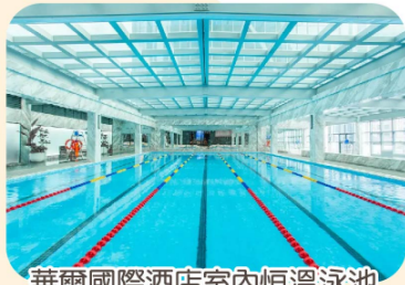
華爾國際酒店室內恆溫泳池