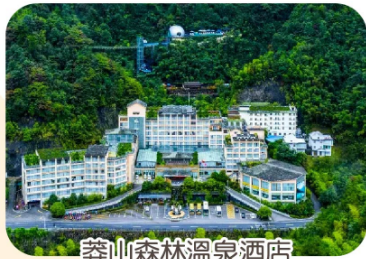
莽山森林溫泉酒店