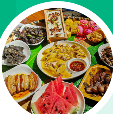
岩洞餐廳 瑤家簸箕宴