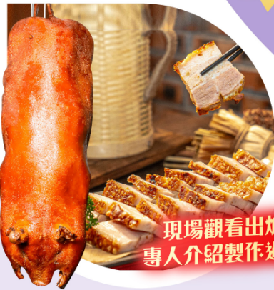
現場觀看出爐 專人介紹製作過程