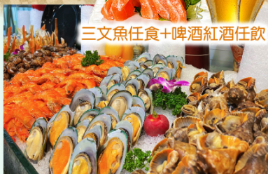
三文魚任食+啤酒紅酒任飲