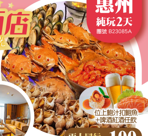
位上鮑汁扣鮑魚 +啤酒紅酒任飲