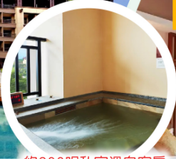
約600呎私家溫泉客房